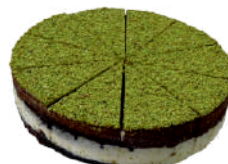
PISTÁCIA 0,75 KG / 10 PORCIÍ