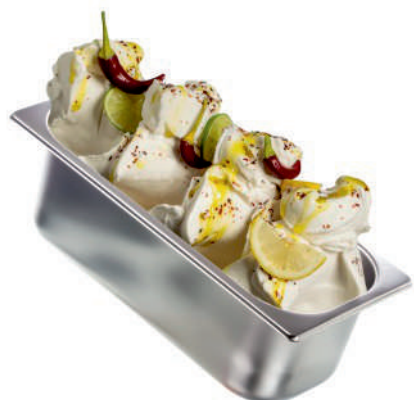
CITRON & LIMETKA & CHILLI