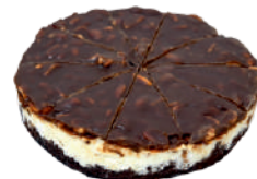
ARAŠIDOVÁ 0,80 KG / 10 PORCIÍ