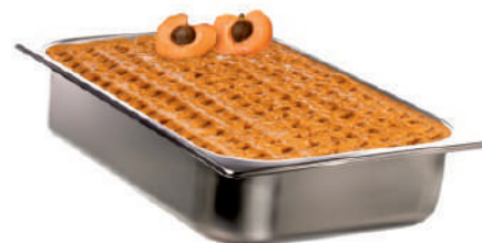
MARHUĽA BIO ID 726002 / 5L