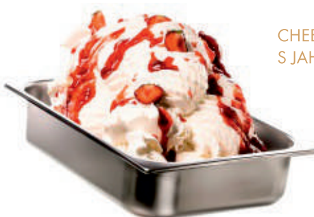
CHEESECAKE S JAHODAMI