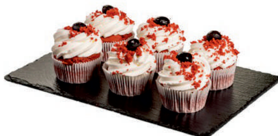
Red velvet muffin višňový Čokoládový muffin s karamelom Čokoládový muffin Cereálny muffin malinový