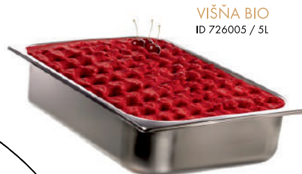
VIŠŇA BIO ID 726005 / 5L

Doporučuje Ondřej Čelůstka, obránca české fotbalové reprezentácie.