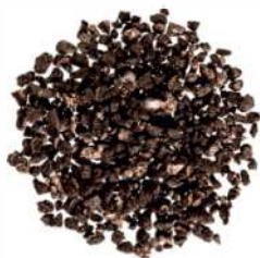
OREO ID 711139 / 0,4 kg