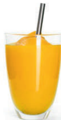
OSVIEŽUJÚCE ĽADOVÉ SMOOTHIE