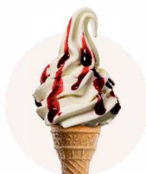
VARIEGATO VIŠŇA + TVAROH TOČENÁ