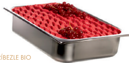
ČERVENÉ RÍBEZLE BIO ID 726006 / 5L