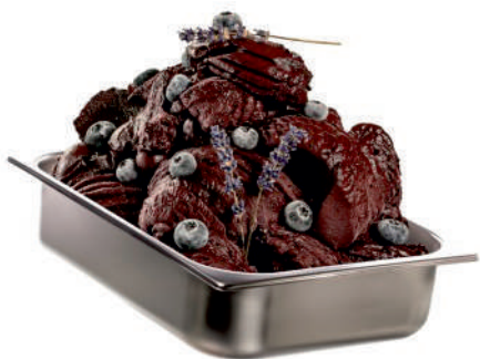
ČUČORIEDKA RAW S LEVANDULOU GRANDE