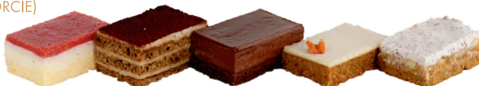
VANILKOVÉ JAHODOVÁ TORTA