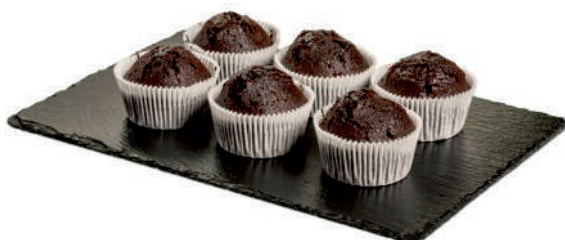
Čoko muffiny Cereálne muffiny Red velvet muffiny