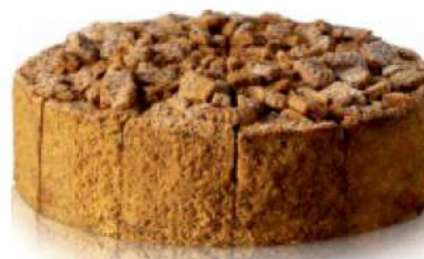
LOTUSKOVÁ S KARAMELOM ID 709091 / 1,75 KG / 14 PORCIÍ