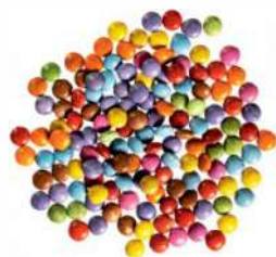
LENTILKY SMARTIES ID 711138 / 0,5 kg