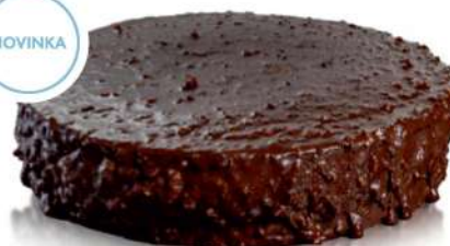
VLAŠÁK V ČOKOLÁDE ID 709110 / 0,95 KG / 12 PORCIÍ