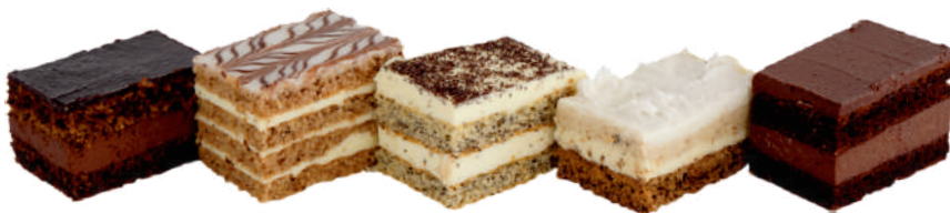
ČOKOLÁDOVO SLIVKOVÁ HARMÓNIA