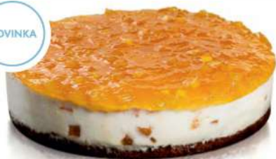
MANGOVÁ TORTA ID 709109 / 1,4 KG / 12 PORCIÍ