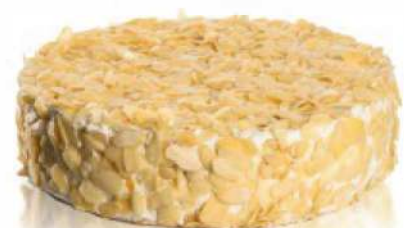
MANDĽOVÁ S KOKOSOM ID 709089 / 0,95 KG / 12 PORCIÍ