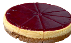
MALINA 0,75 KG / 10 KS