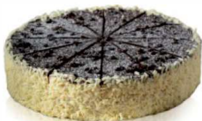
BANÁN V ČOKOLÁDE ID 709094 / 1,62 KG / 14 PORCIÍ