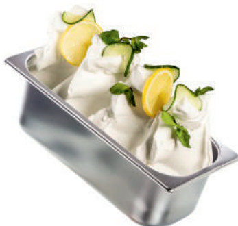
UHORKA & CITRÓN & MÄTA PLUS