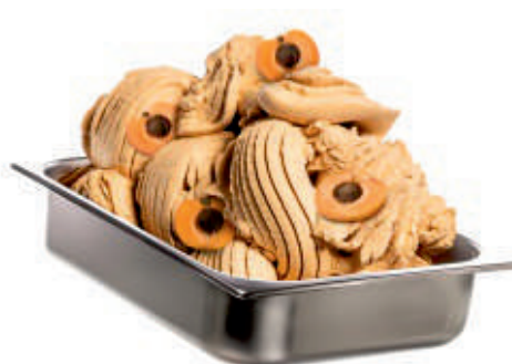
MORAVSKÁ MARHUĽA SORBET