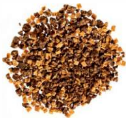
KITKAT ID 711137 / 0,4 kg