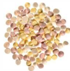
MINI SNEHOVÉ PUSINKY - FAREBNÉ ID 711140 / 0,3 kg