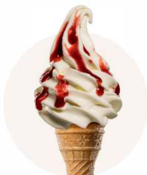
VARIEGATO MALINA + TVAROH TOČENÁ