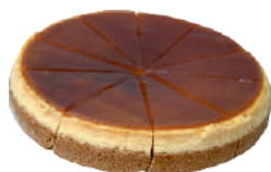
KARAMEL 0,75 KG / 10 KS