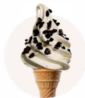
POSÝPKA OREO + TVAROH TOČENÁ