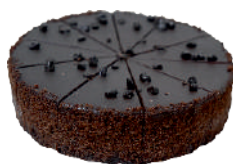
ČOKOLÁDOVÁ 0,75 KG / 14 PORCIÍ