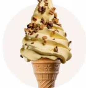
POSÝPKA KITKAT + VANILKA - MADAGASKAR - TOČENÁ