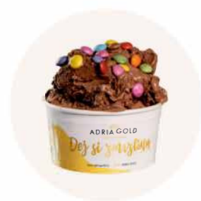
POSÝPKA LENTILKY SMARTIES + ČOKOLÁDA - KOPEČKOVÁ