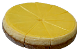
CITRÓN 0,75 KG / 10 KS