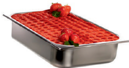
JAHODA BIO ID 726001 / 5L