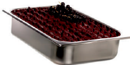
ČIERNE RÍBEZLE BIO ID 726004 / 5L