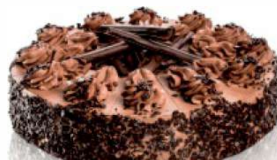
PARÍŽ ID 709042 / 1,15 KG / 12 PORCIÍ